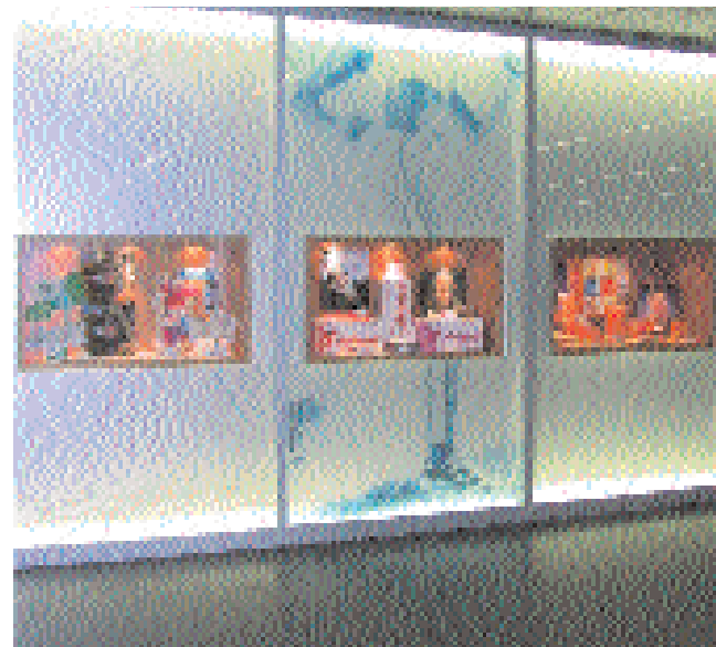
Bestens informiert: Ganzflächig satinierte Schaufenster mit Vitrinen machen Passanten und Kunden die Kompetenz der Apotheke transparent.