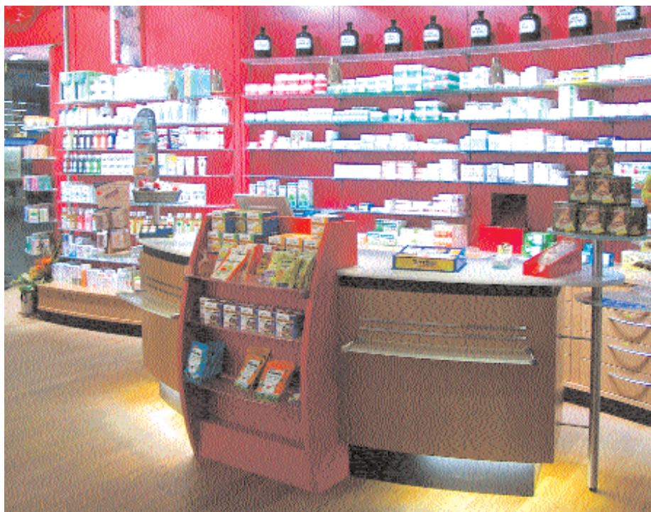
Der Kunde ist König: Die HV-Tische sind dezentral angeordnet und bieten Platz für sechs bis acht Beratungsplätze.